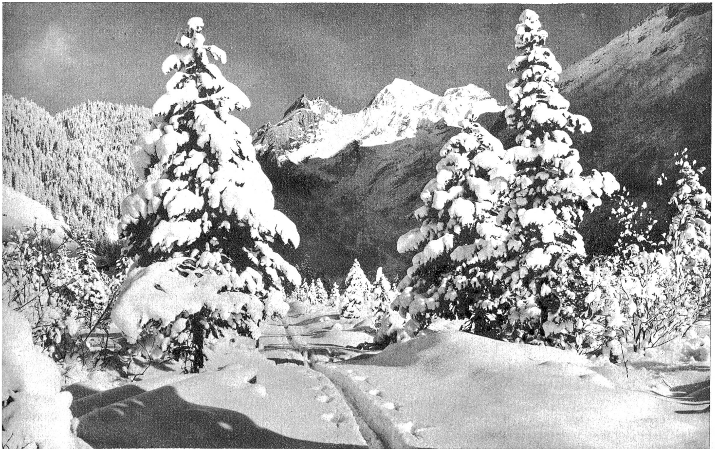
Ob auf Skiern oder mit Schlitten oder auch nur als einfacher Spaziergänger . . . die Natur wird jedem wie neu erschlossen, in der winterlichen Bergwelt.