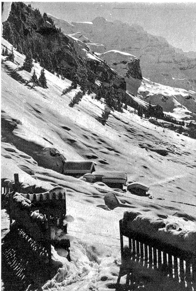
Griesalp, Diemtigtal