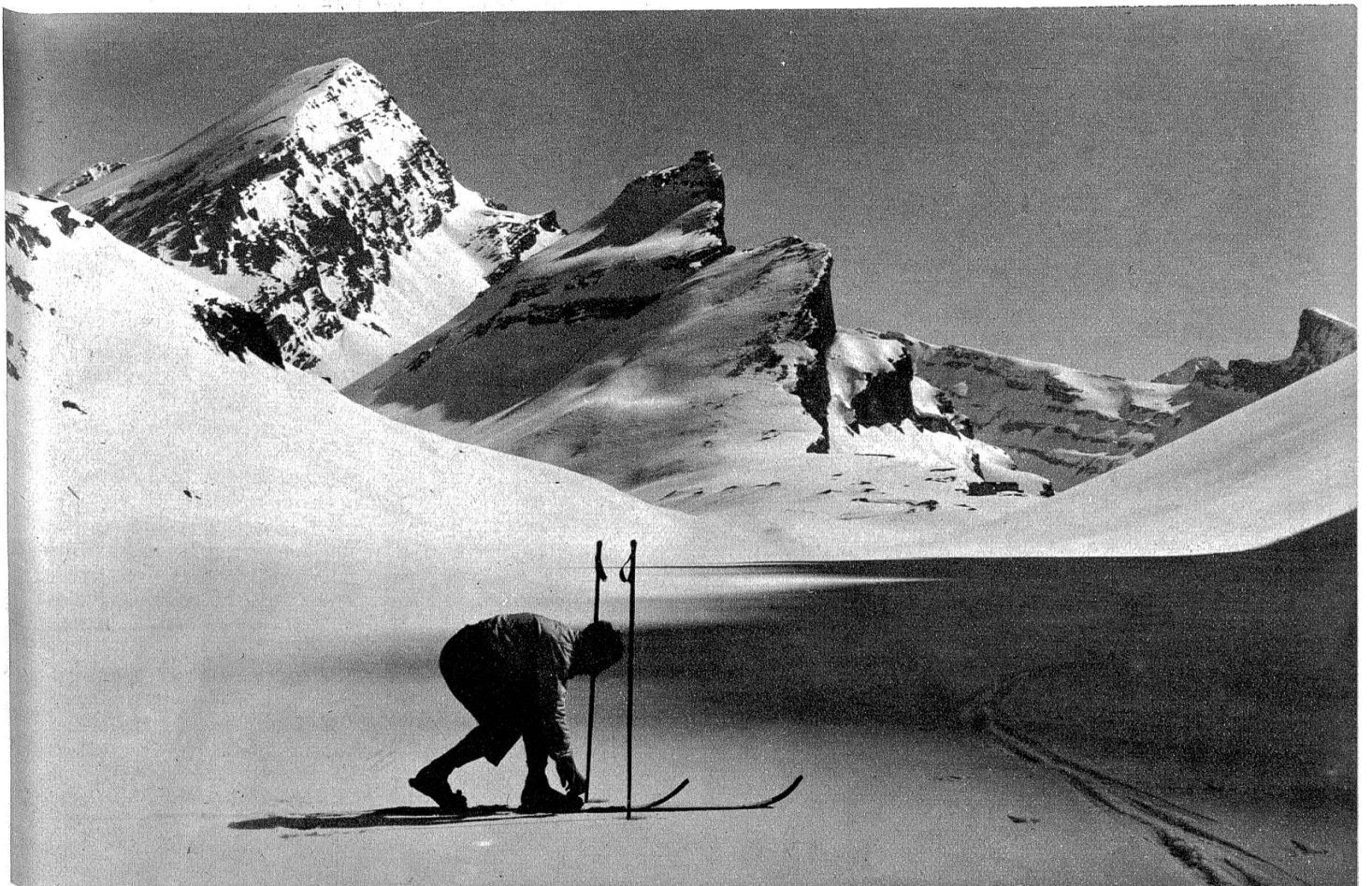
Auf der Gemmi-Passhöhe.