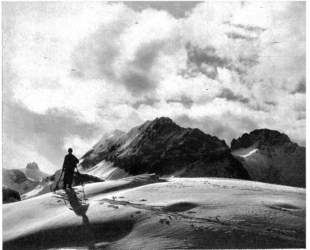
Winterstimmung bei Kandersteg.