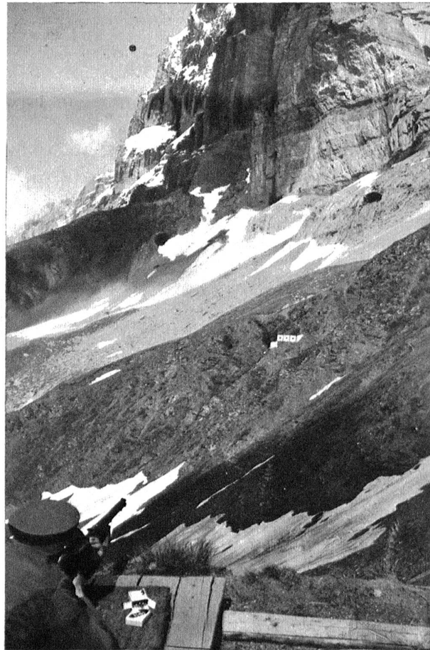
Schiesstand der Schützengesellschaft Jungfraubahn, am Fusse des Rotstockes, zwischen Eigergletscher und Fallboden.