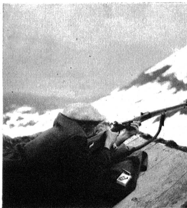
Oft muss der Schütze zwischen zwei Schüssen 5—10 Minuten warten — bis sich der Nebel verzogen hat.