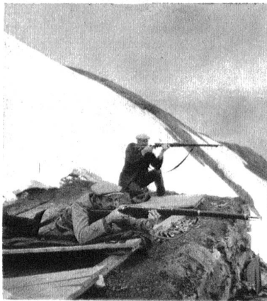
Der Schiesstand ist eine aus dem Fels gesprengte Terrasse von ca. 4 m Länge und 3 m Breite.