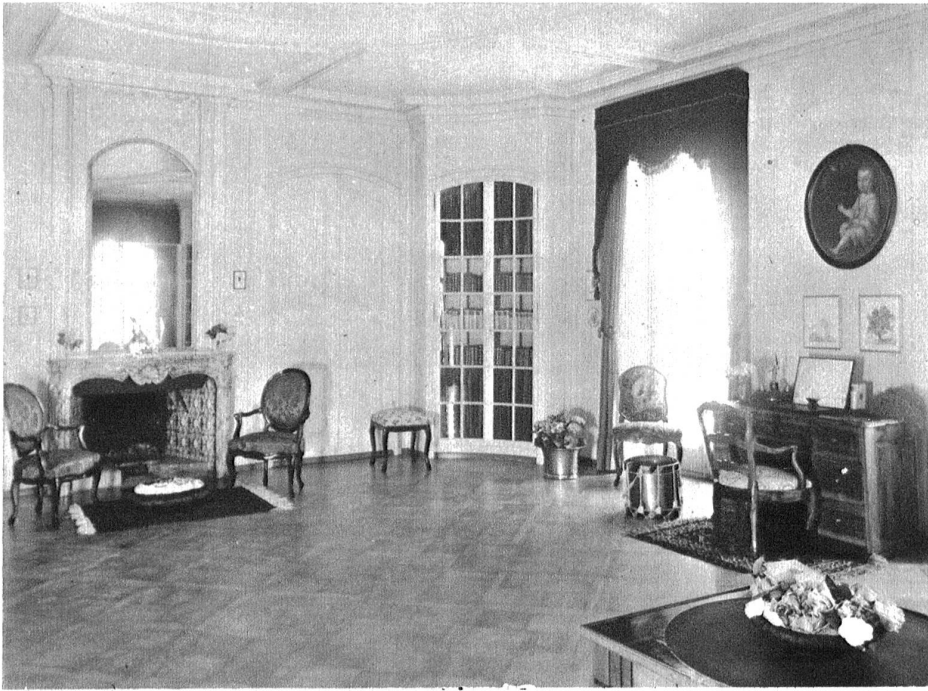
Die Tavelstube im Schloss Jegenstorf mit dem Schreibtisch und anderen von Frau von Tavel in Depot gegebenen Mobiliarstücken, enthält u. a. auch sämtliche Werke des Dichters in ihren handgeschriebenen Originalfassungen.