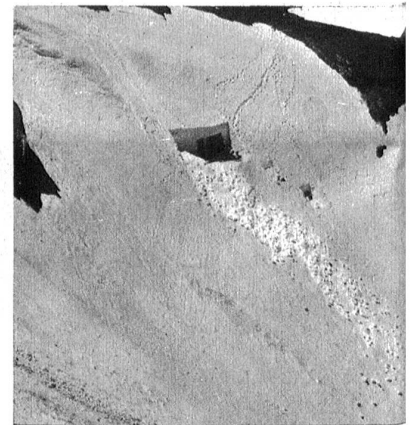
Bevor man schiessen kann im Frühling, muss der Stand aus dem tiefen Schnee ausgegraben werden.