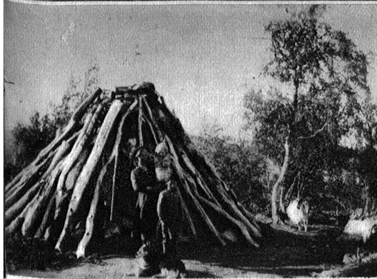
Die Bauart der primitiven Lappenhütten und Vorratspeicher.