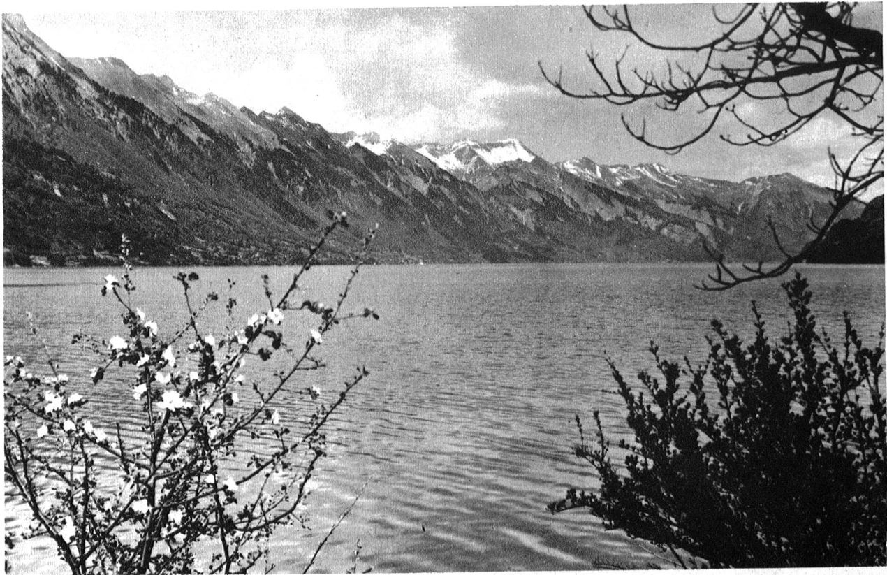
Am Brienzsee bei Bönigen.