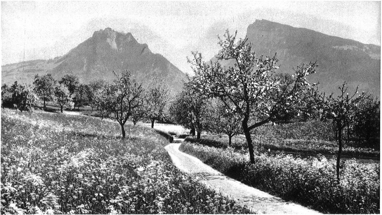
Herdlich ob Spiez, Blick gegen Justistal, Sigriswiler Rothorn und Niederhorn.