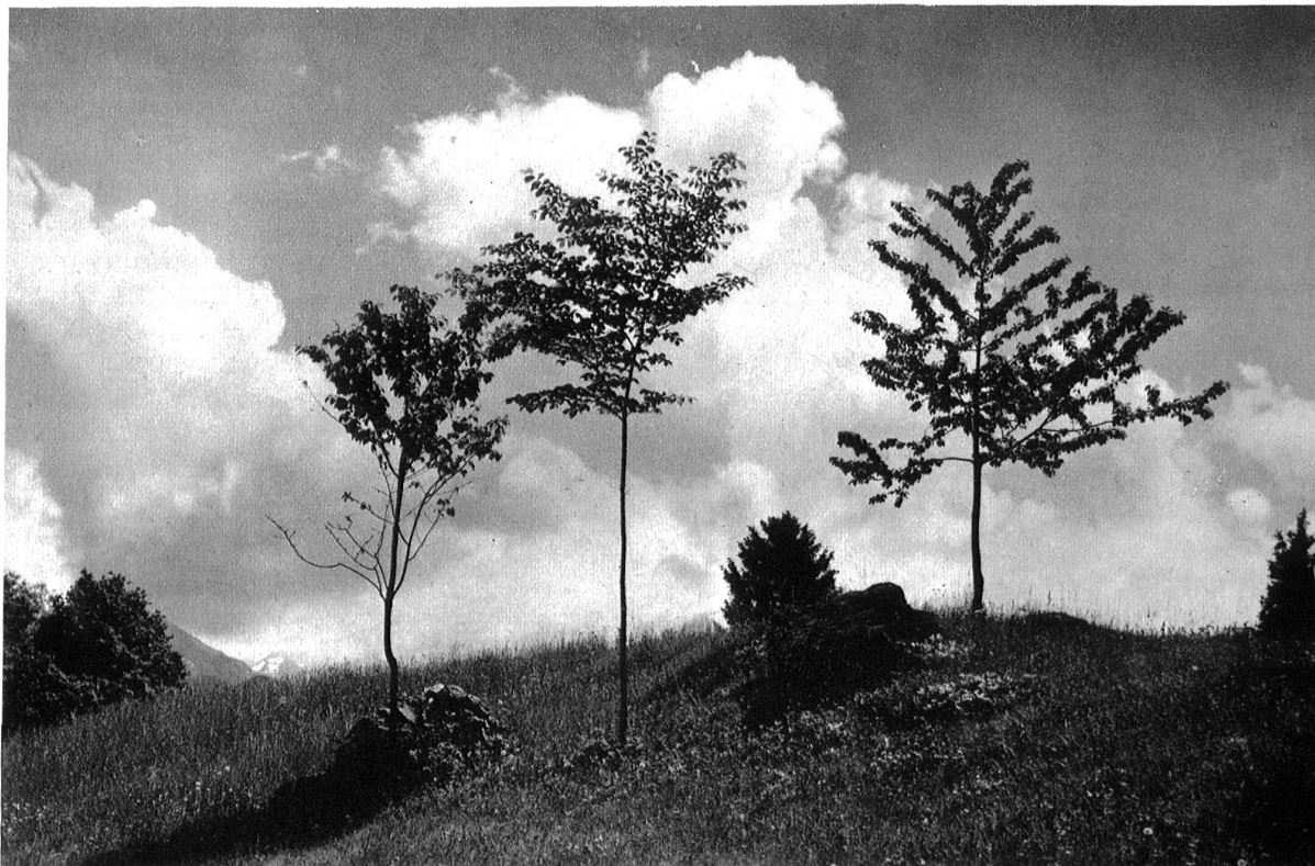
Frühling im Hondrich ob Spiez.