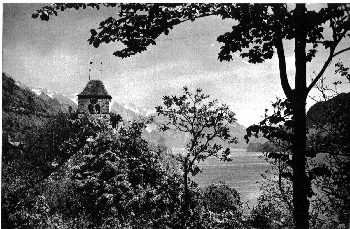
Ringgenberg am Brienzensee, Kirche.