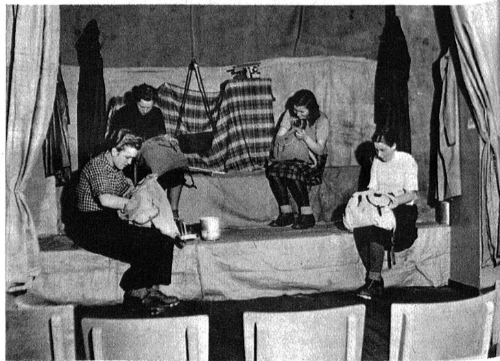
„Gottseidank, ändtliche nes schützens Dach über üsne Chöpfe.“