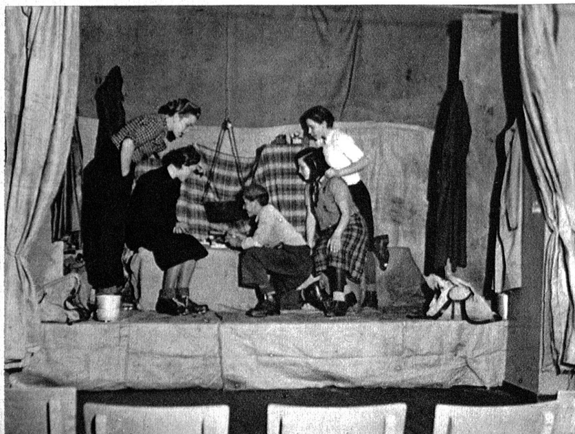
„I bruuche numen eis.“