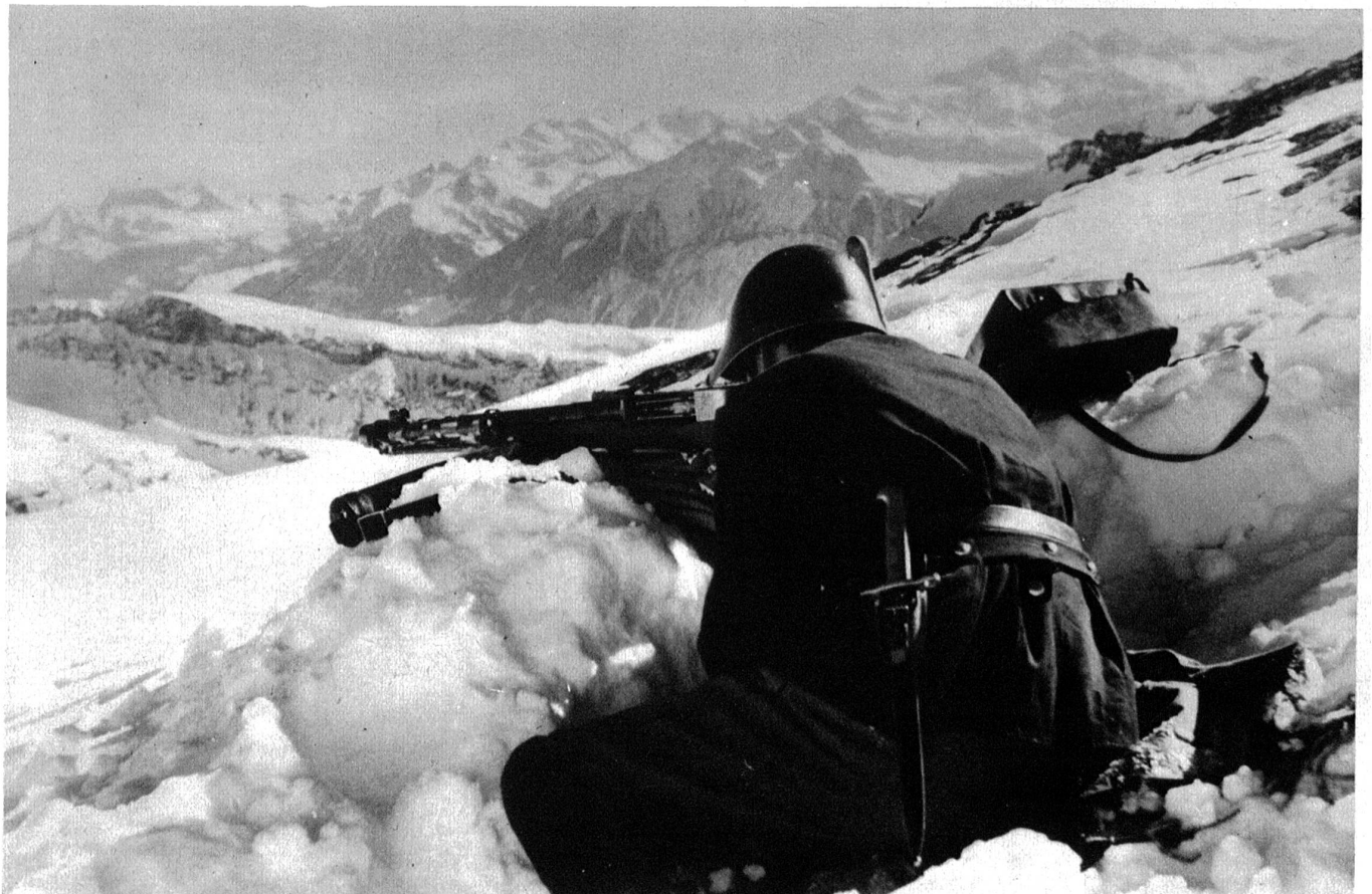
Das Lmg. beherrscht den Uebergang nach dem Rawilpass. Posten P 3124 unter dem Wildhorngipfel.