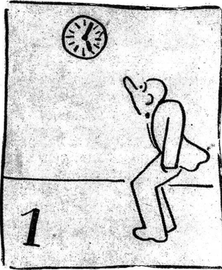
Bumps hat Verpätung.