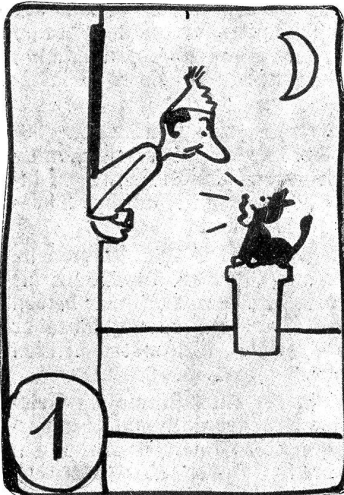
Bumps wünscht Nachtruhe.