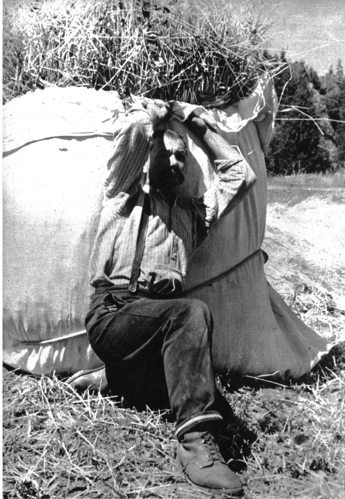
Eine schwere Bürde

Seele zum Himmel aufsteigen, ein jauchzendes Lied der Daseinswonne, des höchsten Lustgefühls von Wachsen und Reifen, in das die leise ahnungsvolle Klage des Welkens und Vergehens wie ferner Sensenklang hineintönt. Und man hört die Lust und das Leid der eigenen Seele in diesem Lied mitschwingen und versteht die Sprache all dieser Myriaden Lebewesen, die aus dem Halmenwald schwirren und zirpen, locken und rufen, summen, pfeifen, flöten und trillern.