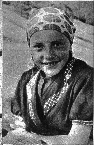
Für die Kinder der schönste Moment des Tages: Die Zvieripause im Feld.

Lebensäußerung in der Wonne des Empfangens. Halm und Aehre stehen regnungslos aufgerecht zur Gottheit, wie in ekstatischem Begehren, und scheu verbirgt sich alles Getier vor dem geheimnisvollen Walten der schöpferischen Stunde. Und der Herr segnet das Feld, daß es vielfältige Frucht trage.