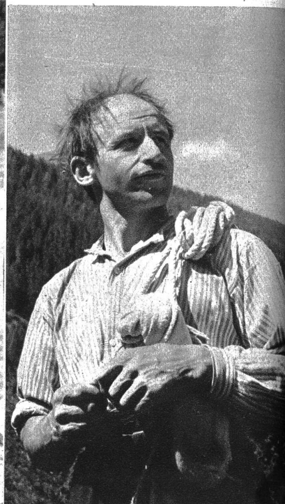
Wildheuer aus dem Wallis

Nur in der Mittagsstunde verstummt und schweigt das Feld. Wenn die Sonne im Zenith steht und die ganze Kraft und Allgewalt ihrer strömenden Strahlenfülle in seinen Schoß ergießt, in heiliger Gebefeligkeit, dann erstirbt jeder Laut, jede andere