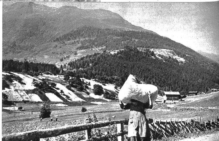
Heimkehr vom Felde. Ernen-Goms