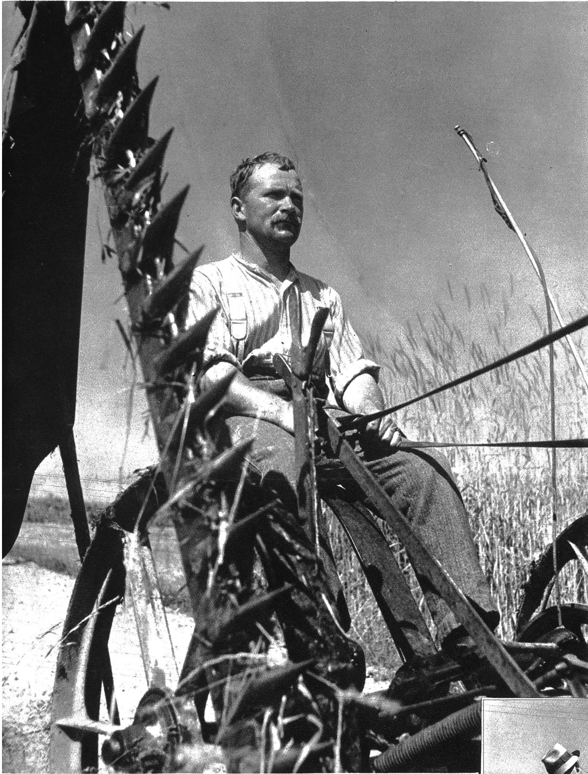
Dort schwere Handarbeit; — drunten im Tale erleichtert die Maschine die „grossen Werke“.