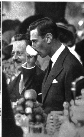
Auf der Gardenparty in Bagatelle. Am Nachmittag des zweiten Tages des Staatsbesuchs fand in Bagatelle eine „Gardenparty“ statt