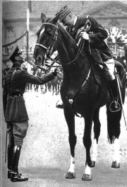
Der König begrüsst General Billotte, den Militärgouverneur von Paris, anlässlich der gewaltigen Truppschau — der grössten seit der Beendigung des Weltkrieges in Frankreich — in Versailles