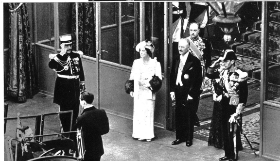
Das englische Königs-paar beim Verlassen des Elysee nach einem Staatsbesuch beim Präsidenten Lebrun. Links Königin Elisabeth, daneben Lebrun, hinter König Georg VI. die Gastin d. französischen Präsidenten