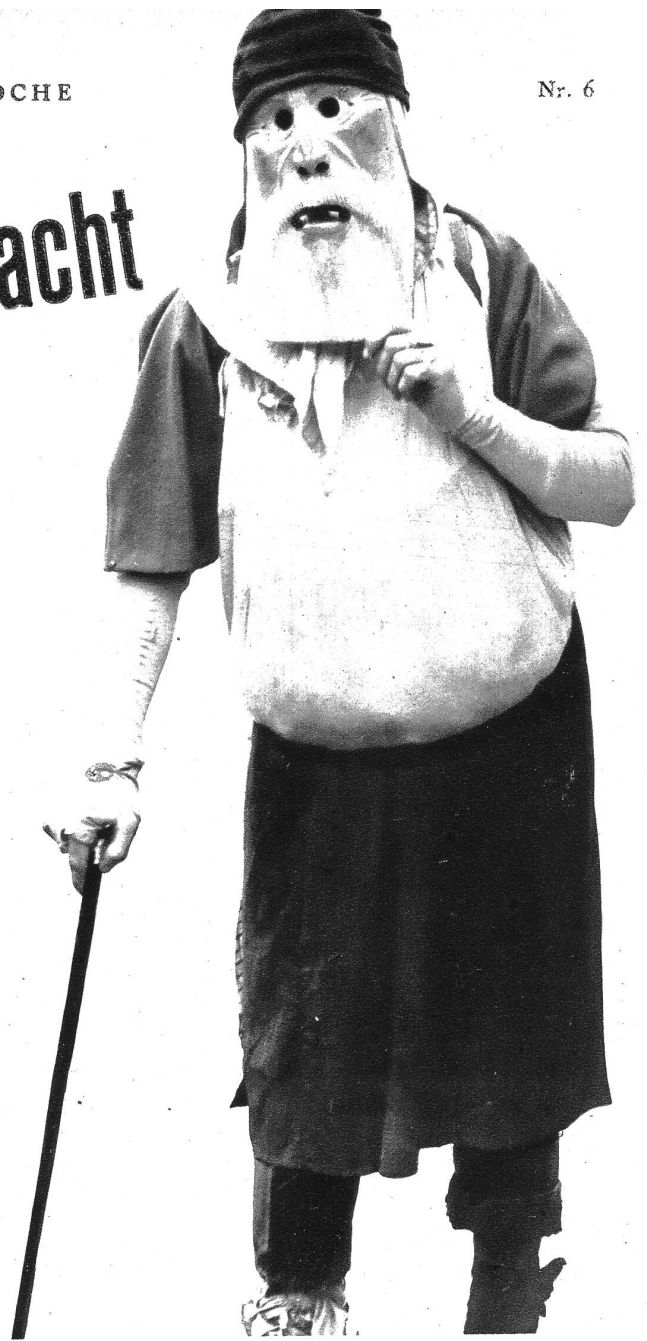
Der „Alte“ von Flums, eine der einfallsreichen Masken des Maskenschnitzers von Flums

Zwischen der Herrenfastnacht und dem Sonntag Lätare spielt sich in unserer Schweiz eine Fülle solcher Kultäußerungen und alten Gebräuche ab, aus der wir nur eine Blütenlese vorlegen wollen. Die Herrenfastnacht oder der Sonntag Estomihi, das Fasten der „Herren“ und der „Pfaffen“ im Mittelalter, und die gleich darauffolgende Bauernfastnacht, der Fastnachtmontag, leiten die Fastnachtsgebräuche allgemein in der Schweiz ein. Am Fastnachtmontag laufen die „Buzi“ und „Hudelweiber“ von Flums, deren Grundsatz ist, möglichst häßlich zu sein, der „Alte“ von Wallenstadt, eine historische Maske, mit