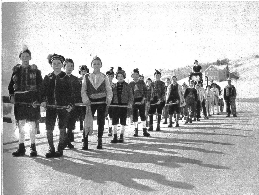
Die Blochfuhr der Buben von Hundwil