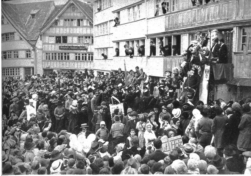
Die Abdankung des Gideo Hosenstoss auf dem grossen Platz an der Buchenstrasse in Herisau