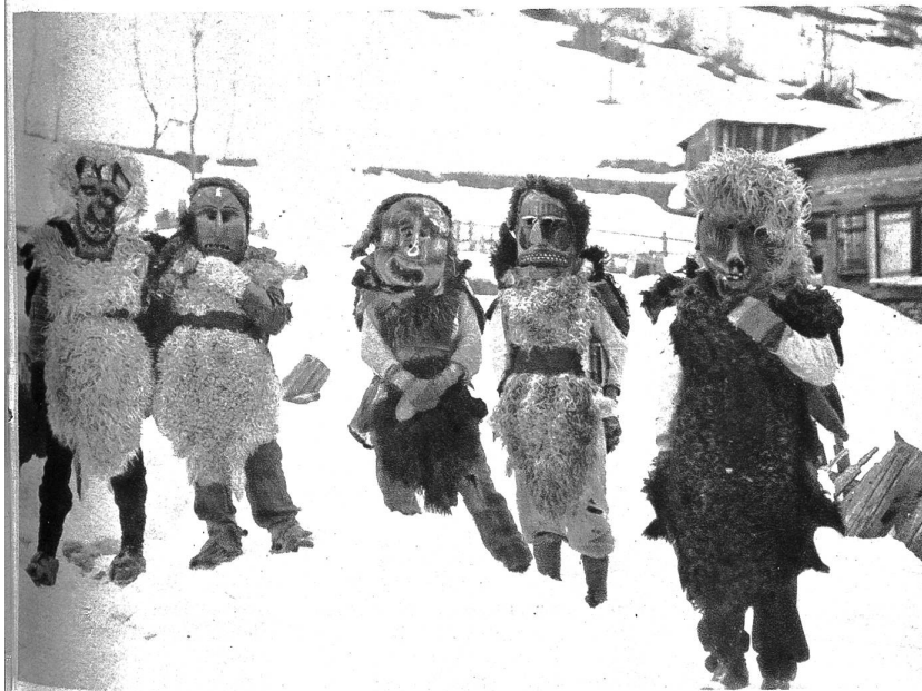
Roitschäggeten-Masken aus dem Lötschental