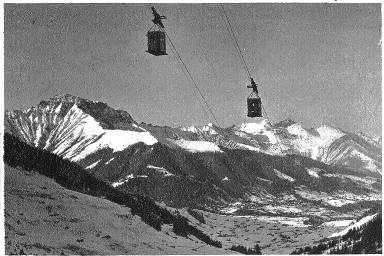
Schwebbahn Engstligenalp (Adelboden)