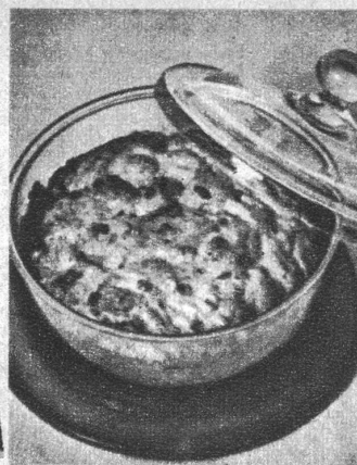
Reisaufguss mit Rosinen