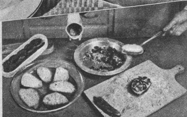
Reiche Ritter bekommen eine Füllung von gekochten Datteln, Rosinen und geriebenen Nüssen