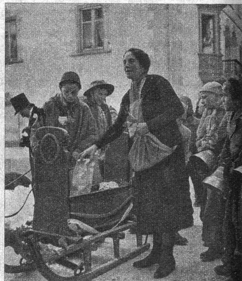
Der «Chef» sammelt die Gaben, die aus Nüssen, Äpfeln, Würsten und Leckerbissen bestehen