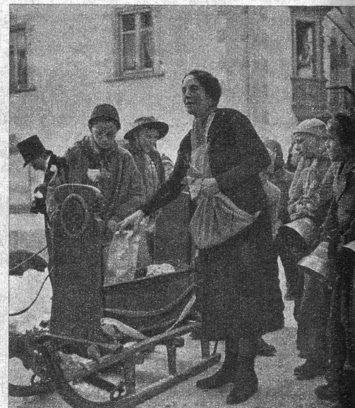
Der «Chef» sammelt die Gaben, die aus Nüssen, Äpfeln, Würsten und Leckerbissen bestehen