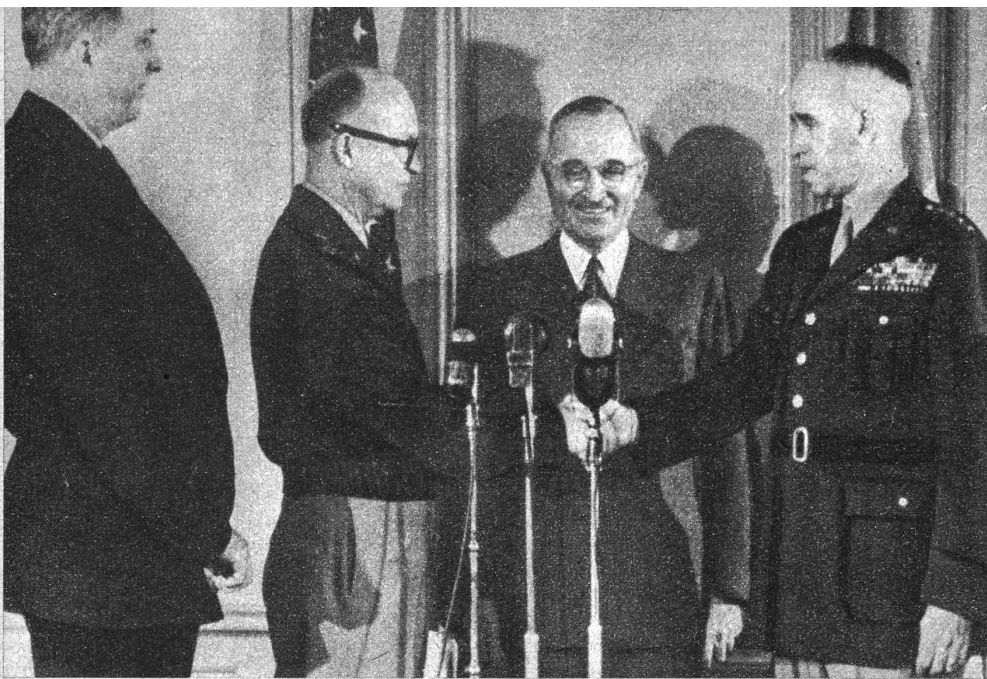
Im Weissen Haus in Washington fand die feierliche Vereidigung des neuen Generalstabschefs der amerikanischen Armee, General Omar Bradley (rechts) statt, die von seinem Vorgänger, General Dwight D. Eisenhower (zweiter von links), nunmehr Präsident der Columbia-Universität, vorgenommen wurde. Der Zeremonie wohnten Kriegsminister Kenneth C. Roy (links) und Präsident Truman bei