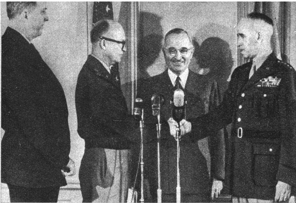
Im Weissen Haus in Washington fand die feierliche Vereidigung des neuen Generalstabschefs der amerikanischen Armee, General Omar Bradley (rechts) statt, die von seinem Vorgänger, General Dwight D. Eisenhower (zweiter von links), nunmehr Präsident der Columbia-Universität, vorgenommen wurde. Der Zeremonie wohnten Kriegsminister Kenneth C. Royal (links) und Präsident Truman bei