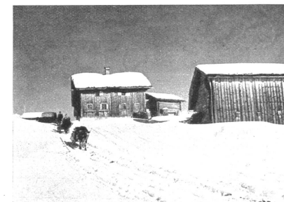
Unterwegs von Safien-Thalkirch nach Safien-Platz

Im Winter ist es im Safiental, einem rechten Nebental des Bodnerheimes, beglückend still und darum eine Kerbenberühigung ohnegleichen für überlebte Städter. Hier weiß man nichts von Stifft, Juni, Seffeltbahn, trotzdem zwischen dem Bärenhorn im Talgrund hinten und dem zerhackten Grat an der Signina und dem Biz feiß sich eine ununterbrochene Folge von Abfahrtschlangen spannt. Und was für Hänge! Weich modelliert und sanft, mit Hüdelein durchzogen, für hundertfache Schwungfolgen geschaffen. Wer weiß das? Die Stiegensteppen bleiben fern, denn nicht einmal ein Postauto fährt im Winter. Nur ein altnobischer Schlitten führt die wenigen Gäste von Veriam ins Tal hinan. Im Frühling hören wir aus dem blau dunkigen Tal empor, sehen plötzlich im Sonnenlicht und staunen, wie sich die Zicht immer freier, immer silberner entfaltet. Doch von dem jachtgeschwungenen Grat wird es ein Tiefbild ins Lugnez und ein Fernbild nach allen Seiten, daß es uns schier den Atem verdrängt. Und wenn man nach der itebenden Fahrt in einen der Safienhöfe tritt z. B. ins jahrhundertalte Turahus (das Haus der Tura-Tura), nimmt uns herzwarmer Gastlichkeit in Empfang, die uns das Wirtlein, 'Gast' gang neu erleben läßt.