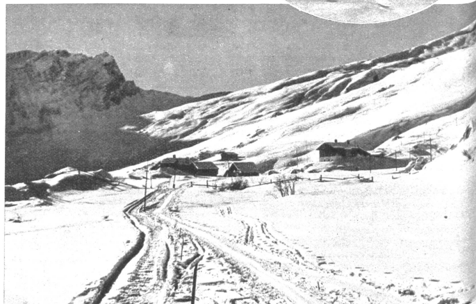
Landschaft beim Turahus