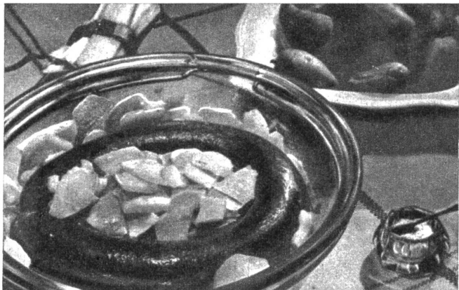
Kohlrabi schmecken besonders gut, wenn eine Fleischwurst mit gedünstet wird