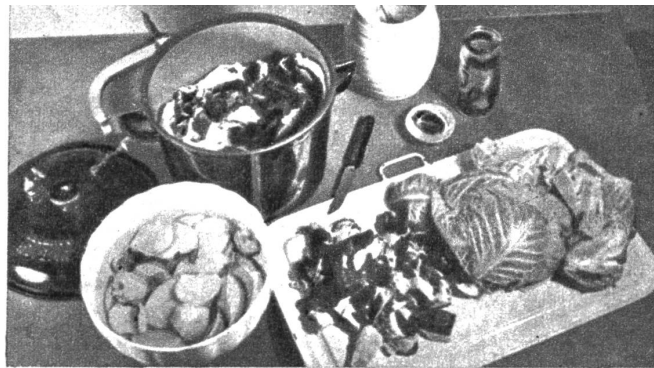
Irish Stew besteht aus Hammelfleisch, Kraut und Kartoffeln