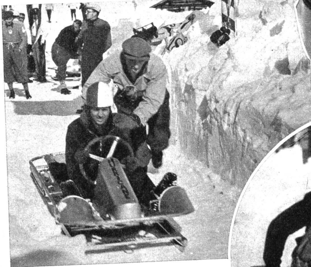
Mitte rechts: Dann begibt man sich an den Start. Der grosse Moment ist gekommen! Sturzhelm und Knieschoner werden angelegt - man kann nie wissen. Oben: Während der Hintermann den Bob in Bewegung bringt, ist der Steuermann sich bereits bewusst, dass es nun ganze Konzentration braucht. Rechts: Ein Bob im vollen Schuss auf der Arosener Bobbahn