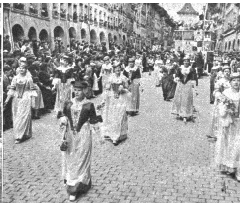
Links: Ausschnitt aus dem grossen Festzug: Ein Detachement Soldaten trägt ein Symbol der eidgenössischen Bundesverfassung von 1848. — Rechts: Im zweiten Teil des grossen Jubiläumsfestzuges zur 100jährigen Bundesverfassungsfeier kam die unzertrennbare Bindung zwischen Volk und Staat sinnig zum Ausdruck. 2000 Trachtenleute aus allen Gegenden der Schweiz begleiteten 3000 Gemeindefahnen als Symbol freier Gemeinden auf ihrem Ehrenmarsch durch die Bundesstadt

Der Wettergott hatte am Sonntag die Veranstalter der grossen Verfassungsfeier gezwungen, den Gedenkakt in der neuerbauten grössten Festhalle der Schweiz auf der Berner Allmend durchzuführen. — Unsere Aufnahme zeigt die vereinigten bernischen Chöre und die Berner Stadtmusik bei einem Vortrag auf der immensen Bühne. Musikalische Leitung W. Aeschbacher