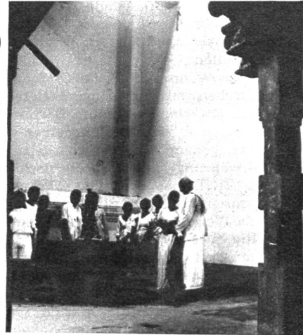
Ehe dem Tempel Blumen, Kerzen oder sonstige Gaben dargebracht werden dürfen, müssen die Geber ihre Hände in heiligtem Tempelwasser waschen

Als den heiligsten Ort der Erde betrachten 400 000 000 Buddhisten den „Tempel des Zahns“ in Kandy auf der Insel Ceylon. In diesem Tempel, dessen Tore aus Elfenbein und Kupfer durch mächtige Elefantenzähne behütet werden, liegt der Zahn Buddhas, den der König von Kandy vor 350 Jahren aus Indien nach Hause gebracht hat. Seit dreieinhalb Jahrhunderten wallfahren die gläubigen Budd-