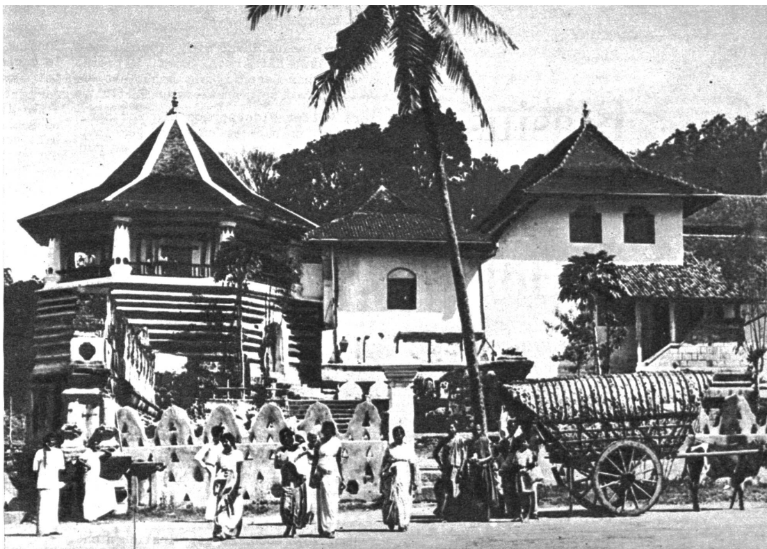
Aussenansicht des Tempels des «Zahns.» Links die achteckige Bibliothek, die im Jahre 1875 durch den damaligen Prinzen von Wales eröffnet und eingeweiht worden ist

Der ganze Tempel steht im Zeichen des Vollmondes. Volle und halbe Monde sind die Symbole und überall eingeschnitten. Wenn auch die Mondfeste sich regelmässig wiederholen, haben die Buddhisten doch im August noch das ganz grosse und besonders wichtige „Ferahera“-Fest, bei dem 40 weisse Tempel Elefanten unter ihrer Last seidener und kostbarer Decken durch die Strassen von Kandy paradien. Die Zähne der Elefanten stecken in mit kostbarsten Juwelen besetzten Lederfutteralen, und mehr als tausend Fackelträger begleiten diese Elefanten, derweil die Teufelstänzer ihre wilden Sprünge unternehmen und ausführen.