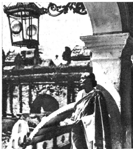
Ein Teller duftender Blüten ist die bevorzugteste Opfergabe der Pilger

Die Lebensarbeit dieses Tempel-Trommlers besteht darin, jahraus, jahrein täglich dreimal trommelnd den Tempel zu umschreiten und durch seine Trommlerei die Gläubigen zu den Gebeten zu rufen