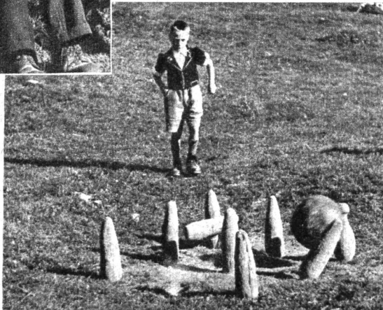
Früh übt sich, was ein Meister werden will. Vorläufig schaut der Hänsel kritisch zu, was die Grossen leisten, aber bald einmal wird auch er die Kugel werfen