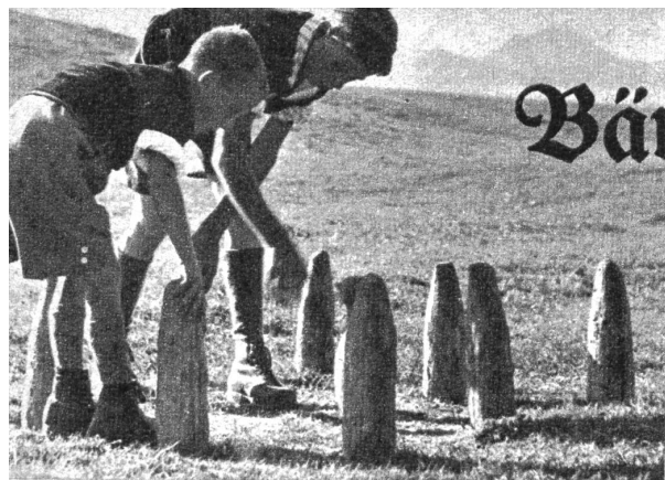
Abgesägte Zaunpfahlspitzen dienen als Ries. Die Sennbuben nehmen ihr Amt genau, das Kegelstellen ist hier auf holperigem Boden nicht so einfach