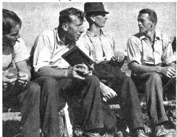
Kritisch betrachtet ein jeder des andern Würfe, und auf einer mitgebrachten Schiefertafel werden die Leistungen notiert

K egeln zählt wie das Jassen gewiss auch zum schweizerischen «Nationalsport». Es gibt ja sogar eigentliche Meisterschaften für das Kegeln, wo männiglich auf hochpolierten Bahnen in millimetergenauem Wurf seine Kunst unter Beweis stellen kann. Dieselben Meisterkegler könnten sich des Lachens kaum erwehren, wenn sie einmal an einem waschechten Bär-Cheiglet teilnehmen sollten, wo das Ries aus abgesägten Zaunspitzen besteht und die