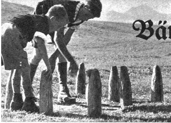
Abgesägte Zaunpfahlspitzen dienen als Ries. Die Sennbuben nehmen ihr Amt genau, das Kegelstellen ist hier auf holperigem Boden nicht so einfach