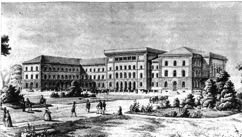
Das erste Bundeshaus oder Bundesratshaus, wie es damals genannt wurde, von der Nordseite

Der Grosse Rat befasste sich mit der bisher sehr umstrittenen Verfassung in einer erneuten Redeschlacht; sie dauerte diesmal immerhin „bloss“ drei Tage