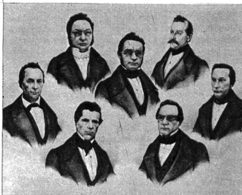
Der erste Schweizerische Bundesrat, dem die Herren Furrer, Franscini, Näff, Druey, Frey-Hérosé, Ochsenbein und Munzinger angehörten