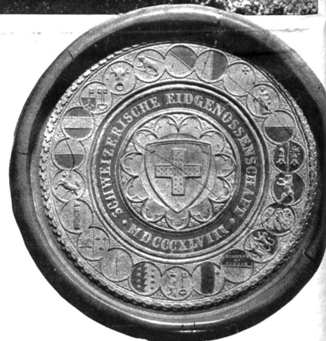
Das Siegel der Eidgenossenschaft seit 1848

klärte ausdrücklich, den Entwurf zu verwerfen. Die Abgeordneten von vier Kantonen verzichteten darauf, Stellung zu beziehen; sie nahmen den Entwurf bloss entgegen, um zuhause darüber zu berichten und weitere Instruktionen zu empfangen. Drei Kantone und ein Halbkanton gaben zu Protokoll: „Wir nehmen den Entwurf nicht an und behalten uns alle religiösen, politischen und materiellen Rechte samt den Entschlüssen unserer Bevölkerung vor.“ Noch eigen tümlicher war die Stimmabgabe der bernischen Abgeordneten Jakob Stämpfli und Dr. Joh. Rud. Schneider; sie erklärten