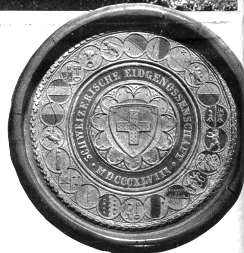
Das Siegel der Eidgenossenschaft seit 1848