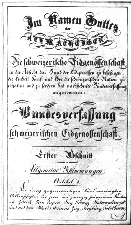
Die erste Seite der Bundesverfassung von 1848

Um uns das Verhalten der beiden radikalen Seeländer zu erklären, müssen wir auf die Grossratssitzung vom 27. Mai 1847 zurückgreifen, also dreizehn Monate zurückgehen. Damals hatte der Grosse Rat den Antrag der Regierung gutgeheissen, der Bundesrevision nicht zuzustimmen. (Die bernischen Tagsatzungsabgeordneten hatten sich dann aber, wie