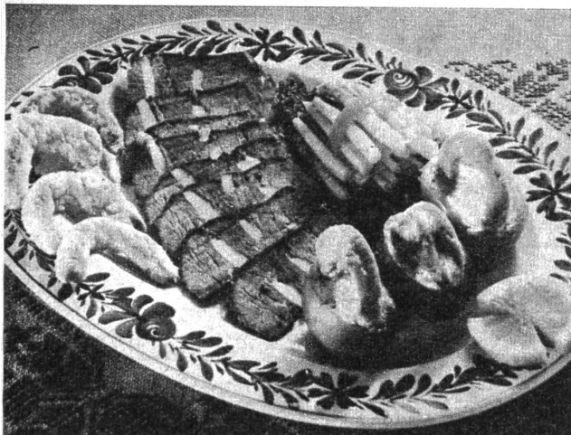
Gespickter Braten, garniert nach Tiroler Art