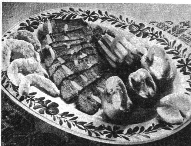
Gespickter Braten, garniert nach Tiroler Art