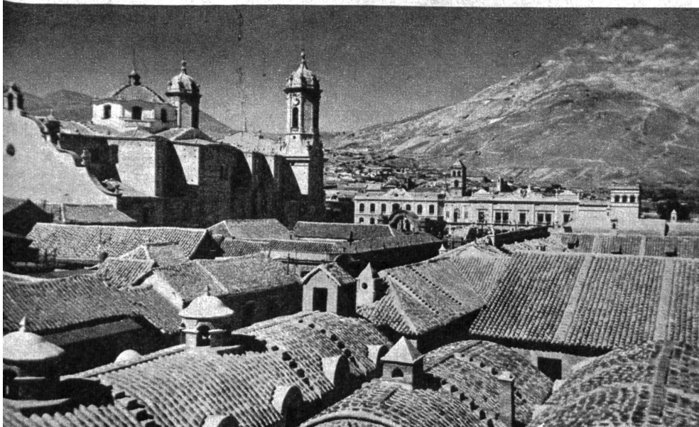
Blick auf die alten Dächer und die Kathedrale von Potosí. Im Hintergrund der «Cerro»