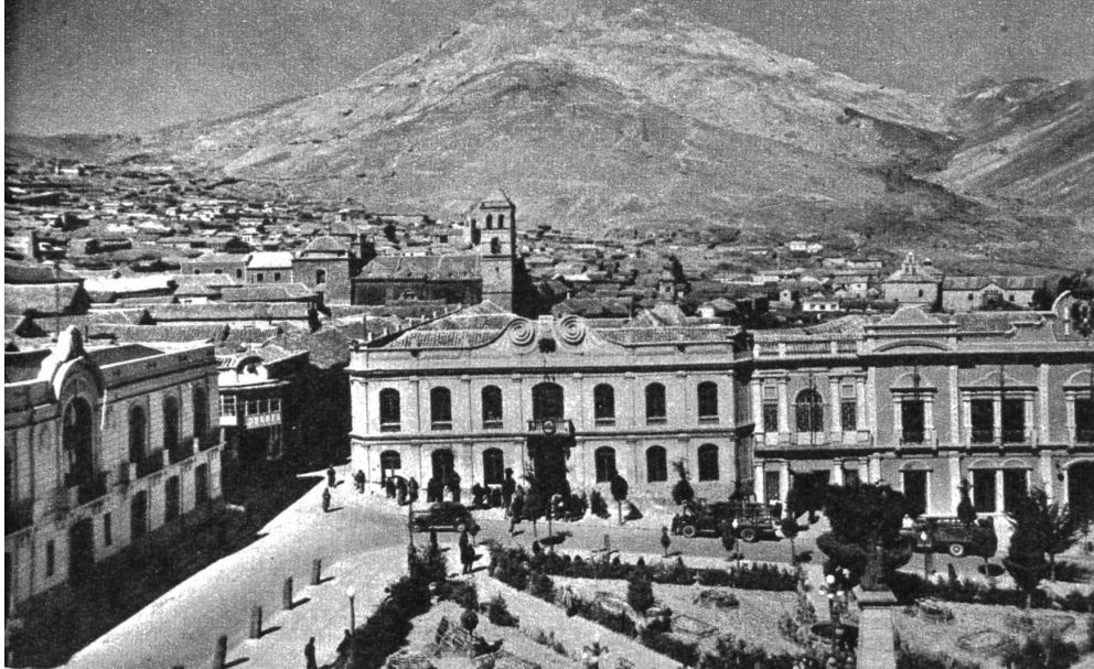
Blick auf die Stadt Potosí, im Hintergrund der berühmte «Cerro rico»