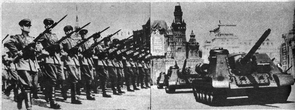
Moskau demonstriert seine Stärke. Moskau feierte das Fest der Arbeit, den 1. Mai, mit einer gewaltigen Truppenparade, die sowohl dem Inland wie dem Ausland die Macht der Roten Armee zum Bewusstsein bringen sollte. Das obere Bild zeigt Tanks neuester Konstruktion, welche in rascher Fahrt über den Roten Platz in Moskau donnerten und unten sieht man den Vorbeimarsch von Eliteinfanterie.

Im Westen... dies ist nach Würdigung jeder östlichen Karikierung des Haager Kongresses zu sagen... würde man mit Laternen nach einer «begeisterten» Aktionsbereitschaft zur Verwirklichung eines europäischen Ueberstaates suchen. Ein holländisches Blatt sprach zwar bereits davon, es werde ein europäisches Parlament, einen europäischen Bürgerbrief und... eine europäische Rekrutenschule geben. Das heisst, das Blatt berichtet seinen Lesern, die den Kongress zusammenrufende «Bewegung für ein Vereintes Europa» erstrebe diese Dinge, und mehr als das: Auch eine «europäische Wirtschaft». Was soviel bedeuten würde wie das Fallen jeglicher Zollschränken. Aber so weit gesteckte Ziele glaubt man nur bei den