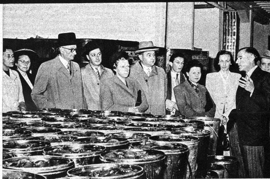
Teilführung der Gäste durch die Fabrik