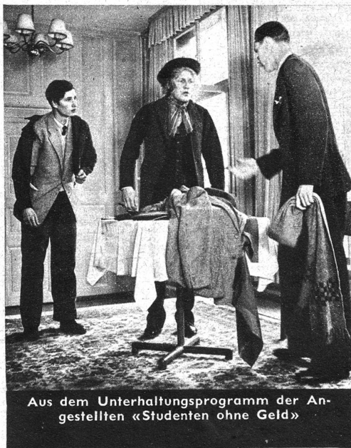
Aus dem Unterhaltungsprogramm der Angestellten «Studenten ohne Geld»

Eine stete Entwicklung des Geschäftes führt zu weiteren baulichen Vergrößerungen in den Jahren 1945 und 1946. Das Fabrikareal ist von 2104 qm im Jahre 1898 auf 10 764 qm im Jahre 1948 angewachsen. Einer dringenden Notwendigkeit Folge gebend und hauptsächlich, um die Kundschaft auch während der grossen Einmachzeit im Sommer möglichst reibungslos und prompt bedienen zu können, beschloss der Verwaltungsrat am 23. Juli 1947, die Fabrik neuerdings zu vergrössern. Es werden 2126 qm Raum geschaffen und die bisherige Fabrikationsanlage nahezu verdoppelt. Mit dem Fabrikneubau wurde am 15. September 1947 begonnen, und die Fertigstellung wird im Jubiläumsjahr 1948 ihrer Vollendung entgegengehen. Daneben wurden in Marin bei St-Blaise, am Neuenburgersee,