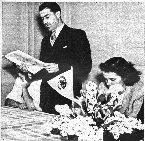
Vorlesung der Jubiläumsschrift