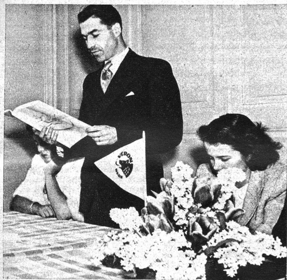
Vorlesung der Jubiläumsschrift