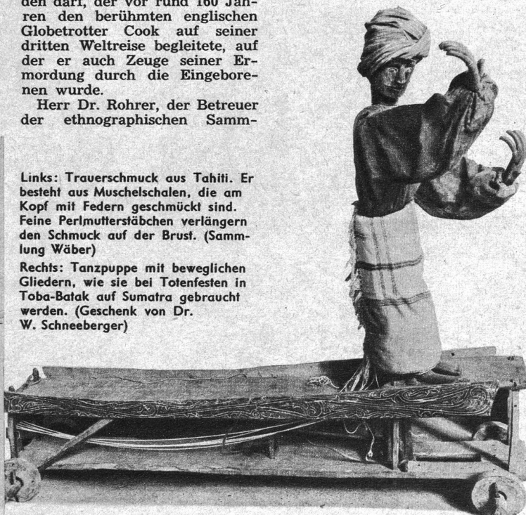
Rechts: Tanzpuppe mit beweglichen Gliedern, wie sie bei Totenfesten in Toba-Batak auf Sumatra gebraucht werden. (Geschenk von Dr. W. Schneeberger)