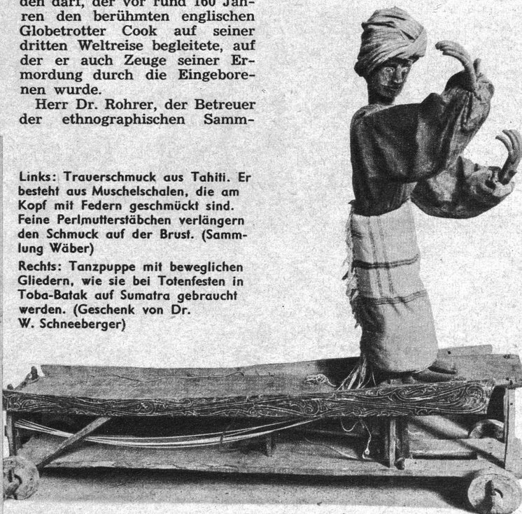
Rechts: Tanzpuppe mit beweglichen Gliedern, wie sie bei Totenfesten in Toba-Batak auf Sumatra gebraucht werden. (Geschenk von Dr. W. Schneeberger)