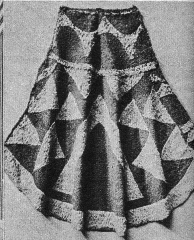
Federmantel aus Hawaii. Dieser wurde von J. Wäber im Jahre 1791 nach der Schweiz gebracht. Er besteht aus einem Olona genannten Gewebe, das ganz mit roten (vom Vogel Fiwi) und gelben Federn (vom Vogel Oo) besteckt ist. Der Mantel ist ein äusserst seltenes Exemplar, von denen es nur noch ganz wenige gibt und die auch nicht mehr angefertigt werden können, weil heute diese Vögel ausgestorben sind