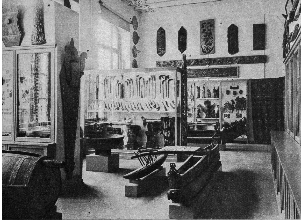
Teilansicht des Saales der ethnographischen Sammlung der Südseevölker