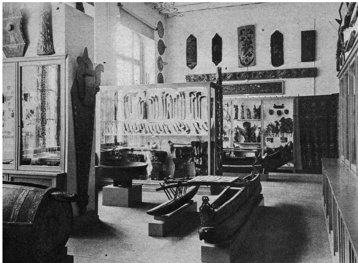
Teilansicht des Saales der ethnographischen Sammlung der Südseevölker