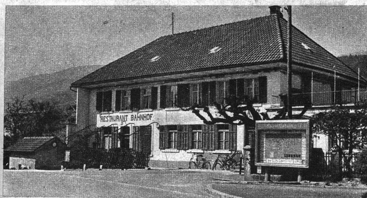
RESTAURANT BAHNHOF LENGNAU P. KUNZ-RIHS, Tel. 7 81 32

LENGNAU VELOS, NÄHMASCHINEN RADIOS, STAUBSAUGER TELEPHON (032) 7 82 01