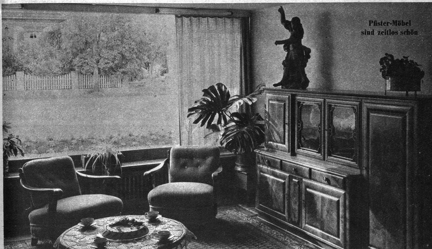
Pfister-Möbel sind zeitlos schön

Welch traumhaft schöne Stimmung spricht doch aus diesem vorbildlichen Intérieur! Räume voller Behaglichkeit und Atmosphäre sind die liebevoll gepflegte Spezialität der Möbel-Pfister AG. Kultivierte Intérieurs dieser Art kosten bei dieser Firma weniger als Sie glauben! Grosse Wohnkunst-Ausstellungen in Basel, Zürich, Bern, sowie in der Fabrik in Suhr bei Aarau. Reisevergütung bei Kauf einer Einrichtung. Franko-Hauslieferung überallhin. Den neuesten Katalog 1948 verlangen! Zustellung gratis. Dieses vornehme Intérieur ist jetzt in unsern Ausstellungen zu besichtigen! Möbel-Pfister AG, gegründet 1882.