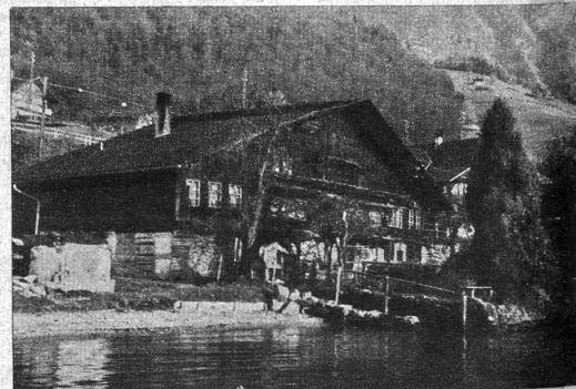
Die Gerbe. Der Spruch an der Hausfront erinnert daran, dass während dem Bau des Hauses der Wein ausnehmend billig war

Den meisten Bewohnern gelang es, das Vieh ins Freie zu lassen. Sonst aber konnte in dem obersten Dorfteil fast nichts gerettet werden, da die aus Holz gebauten Häuser rasch brannten und die Hitze immer unerträglicher wurde. Nun langten von allen Seiten Spritzen an, sogar vom anderen Ufer des Sees und von Thun, wo sich die Feuerwehr vom Boot «Stadt Bern» nach Merlingen fahren liess. Den vereinten Anstrengungen der Ortsfeuerwehr und den 25 auswärtigen Korps gelang es, das wütende Element oberhalb der hohen Mühle aufzuhalten.