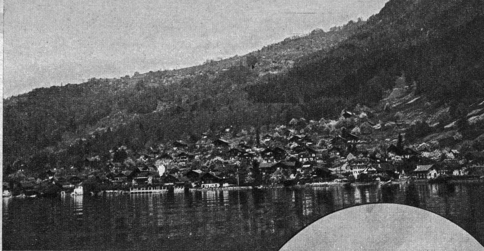
Merligen, das sogenannte Vordorf

Der Römer hält es allgemein als unter seiner Würde, den fremden Gast zu übervorteilen. Auf die Frage, was eine Arbeit von 20 Minuten an meinem Fahrzeug kostete, wurde mir in Rom stolz erklärt: «Das geht gratis, Signore, gute Reise!» Diese Mentalität finden wir selbst in der Heimat immer seltener. hr.