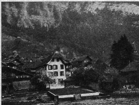
Die unterste Mühle in Merlingen

Am 11. April sind 50 Jahre verflossen, seitdem das so sonnig und heimelig am blauen Thunersee gelegene Dorf Merlingen, das sich von der Ueberschwemmungskatastrophe vom 16. Juni 1856 ordentlich erholt hatte, aufs Neue eine schwere Heimsuchung durchleben musste. Da hatte am Ostermontag oben im Dorf ein Mann mit brennender Tabakspfeife die Heubühne betreten und wahrscheinlich, ohne es zu achten, ein glimmendes Stücklein Kraut auf den Boden fallen lassen. Um halb sieben Uhr abends schlugen Flammen zum Dach hinaus, mächtig angefacht von dem aus dem Justistal niederpflegenden «Heiterluft». Im nächsten Augenblick ergriff das wildlodernde Feuer die benachbarten Gebäude am Grünbach und jagte die Funken mit teuflischer Gewalt gegen das Dorf hinab. Ich sehe noch heute, als ob es letzte Nacht gewesen wäre, wie das glühende Flammenmeer von einem Dach auf das andere sprang und Haus um Haus vernichtete. Wohl