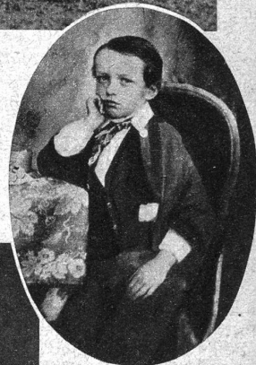
Oben: Ulrich Wille als vierjähriger Knabe