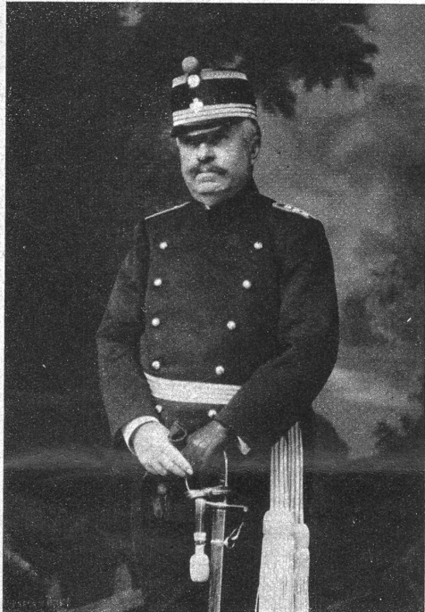
General Ulrich Wille, wie ihn alle diejenigen in Erinnerung haben, die den ersten Weltkrieg miterlebten

Doch eine jähe Schlucht sperrte schliesslich seinen Weg. Das Band brach