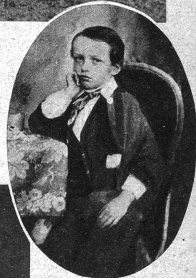
Oben: Ulrich Wille als vierjähriger Knabe