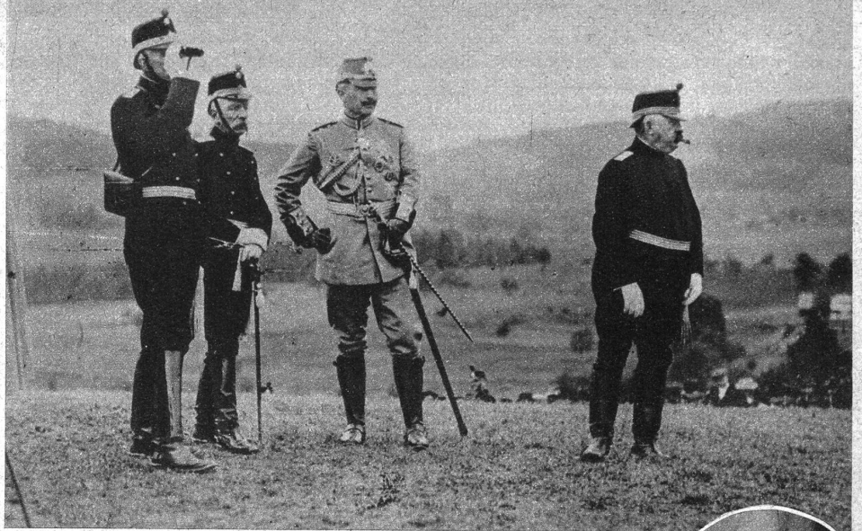
Oberstkorpskommandant der dritten Armee Ulrich Wille (rechts) anlässlich der Manöver 1912 zu Ehren von Kaiser Wilhelm II.