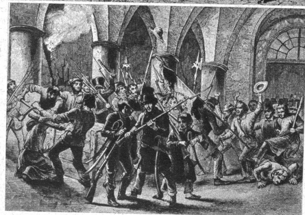
Rechts: Das Volk stürzte ins Zeughaus in Berlin und hoffte mit den Waffen zu siegen, aber es blieb ein mutiges Umsonst! General Wrangel zog mit 15 000 Mann gegen Berlin, die Bürgerwehr, anstatt zu kämpfen, eilte ihm mit Blumen entgegen. Die «preussische Ordnung» siegte!

Rechts oben: Aus den Tagen der Berliner Revolution. Das Volk schreibt an den Königspalast «National-Eigentum». Es waren nur Worte, denen keine Taten folgten