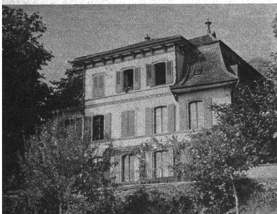
Oben: Die ehemalige Villa de Pury ist das heutige Spital Unten: Die oberi Schmitte

Wie vorher die hohen und niederen Adeligen und die Klöster der nähern und weitem Umgebung, so sicherte sich seit