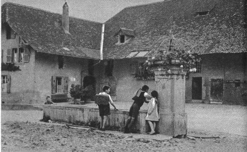
Auf dem Dorfplatz steht das Gemeindehaus, ebenfalls ein sehr altes Haus, das früher als Bauernhaus diente und einen gewissen burgundischen Baustil aufweist (Tore rund)