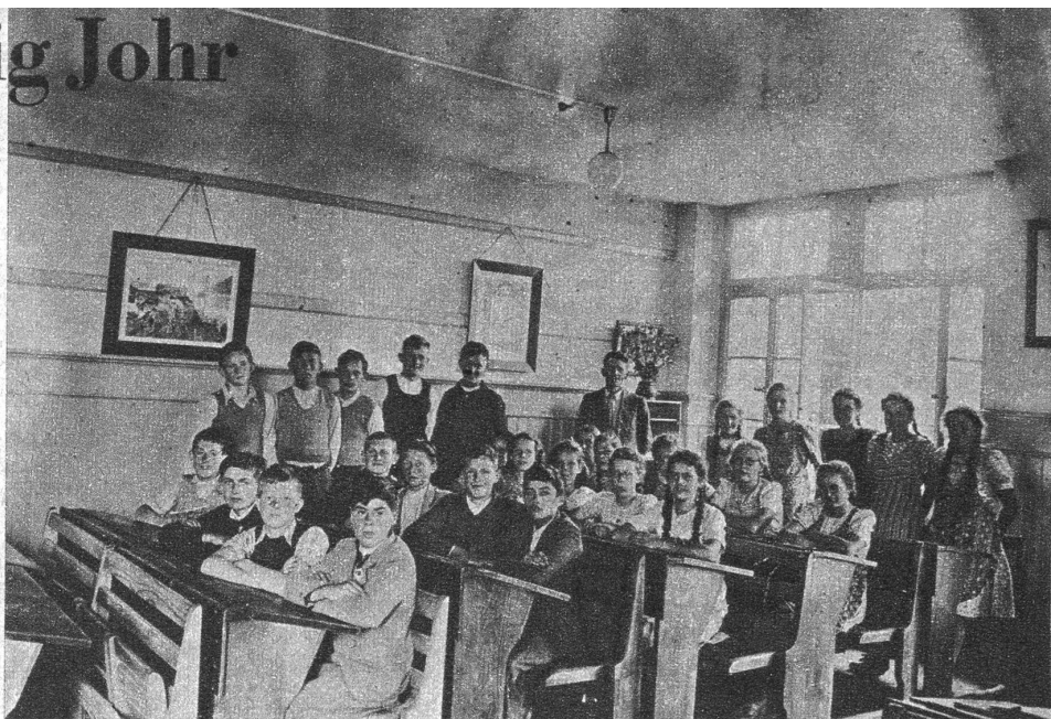
Helle und freundliche Schulzimmer erleichtern der Inser Jugend das Lernen

Am 13. Aberelle 1896 häi mier 81er vo Eiss üses letschte Schueljohr agfange. Feuf Mäitli un sächs Buebe vom Lehrer Kurth hätti ohni wyters i die oberschi Klass vo dr neu gründete Sekundarschuel chönnen yträtte. Do si aber zest nid all Eltere yverstange gsi, un es het a verschiedenen Orte Flüech u Treene gee. Bi üs han is dr Mueter u dr Grossmueter gha z'verdanke, dass i ha dörfen i die Schuel go. Dr Vatter het d'Chöschte gschücht, un dr Unggle isch o schwer drgege gsi. Wo-n-ihm aber versproche ha, i well de glych all Morge go dr Stahl mischte, d'Chalbli dränke, mit dr Milch i d'Cheeserei, d'Chüe butze un i de grosse Weerche am Vieri go chöle (grase), do het'r dene Froue müesse nohgee, bsungers wil du no grad dr neu Lehrer z'üs isch z'Hus cho un o für mi gredt het. I ha nid e wyte Schuelweg gha, aber das weerde die jetzige Schuelching scho glaupe, dass i nit