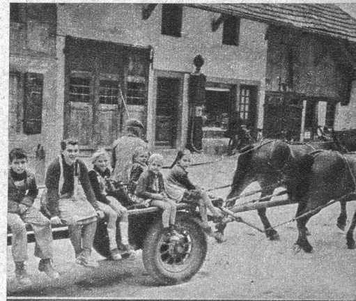
Heimwärts vom Felde