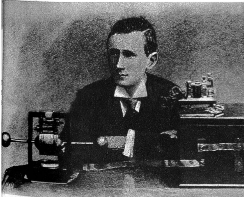
1897, der junge Marconi mit seinem Apparat in London