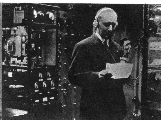
Marconi spricht von seiner Yacht aus zum erstenmal auf drahtlosem Wege mit Sidney

hundreds Riesenfortschritte. Tag und Nacht sass der Erfinder Marconi bei seinen Versuchen, restlos darauf bedacht, neue Verbesserungen und Verfeinerungen herauszuarbeiten. Sein ganzes Leben hindurch tat er ja alles selbst, denn nur das konnte zum Ziel führen, seien es grosse oder kleine Dinge. Als später seine Erfindungen einen immer grösseren Raum einnehmen und er nicht überall dabei sein konnte, war er doch der Initiator für alles, und sein Stab getreuer Mitarbeiter setzte das in Wirklichkeit um, was er anordnete.