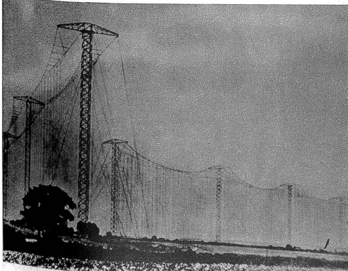
Der Richtstrahler in Bridgewater (England)