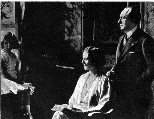
Marconi im Kreise seiner Familie