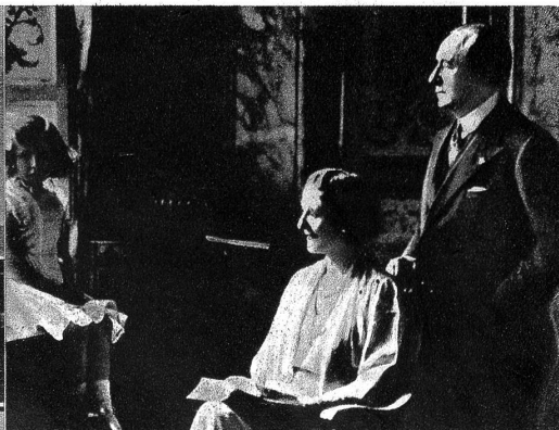
Marconi im Kreise seiner Familie