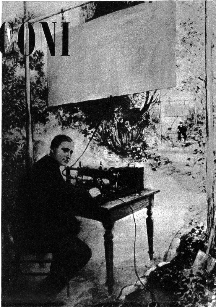
Marconi mit seinem ersten Radioapparat