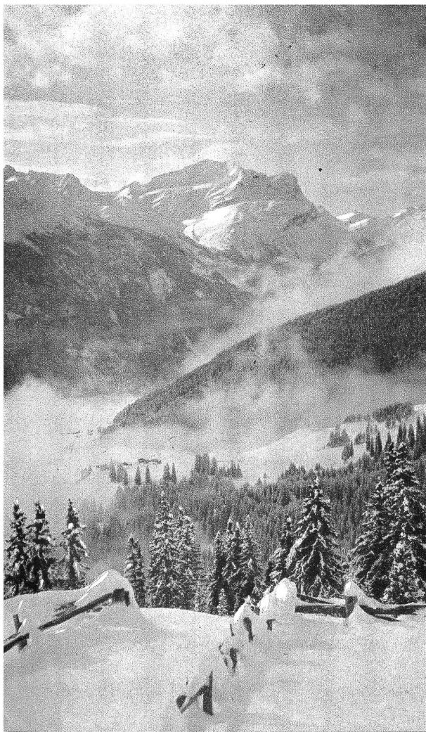
Auf allen Höhen liegt das Morgenlicht, nur im Tale schwimmen noch immer die Nebelschiffe. Dort drunten, in den Dörfern, ist jetzt bange Zeit; denn in dem meterhohen Schnee ist schwer zu holzen. Und allen Bergburschen und Männern wird dadurch keine hinreichende Beschäftigung geboten, höchstens einigen von ihnen. Von den Verdienstmöglichkeiten gar nicht zu reden.

Aber die «Berghilfe» nimmt sich auch der jungen Töchter und der Frauen an: In Spinn- und Web-, in Näh- und — wie ist das so wichtig im Bergland! — in Flickkursen, in Finken-, Haushaltungs- und Säuglingspflegekursen lernen sie, wie man sich auf die zweckmässigste Art behelfen kann, auch dann, wenn man halbtageweit vom nächsten Laden wohnt.