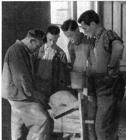
Kleine «Vörteli» lernt man am Schleifstein — wie anders geht die Arbeit doch, wenn auch das Werkzeug musterhaft in Ordnung ist! Wem auch das nötigste Werkzeug fehlt, der bekommt es gegen geringes Entgelt von der Berghilfe; geschenkt wird nichts, hat doch nur jenes Wert in solcher Burschen Augen, für das sie selber etwas leisten müssen.

«Berghilfe»-Sammlung 1947: Postcheckkonto VIII 32443 Zürich.