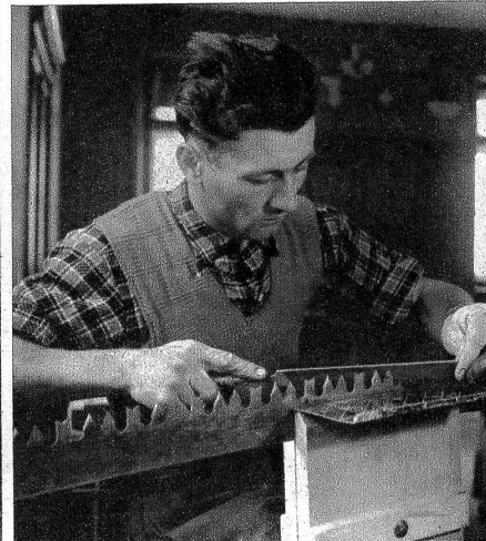
«Mit dem geringsten Kräfteaufwand maximale Leistung» — dieses Prinzip ist in den Selbstversorgerkursen richtunggebend. Wohl ist es wahr, dass manche der Bergbauernarbeiten mühsam sind; aber doch lässt sich allerlei vereinfachen. Darum müssen die jungen Männer lernen, wie sich eine Waldsäge auf die beste Art schärfen lässt.