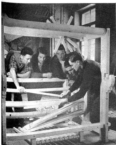
Rechts: Seit ein Werklehrer aus dem Unterland im Auftrag der Berghilfe eingezogen ist, beginnt ein ungewohnter Eifer sich zu rühren. Die Gemeindestube wird ausgeräumt; die Hobelbänke des Dorfes werden herbeigetragen — und dann hebt ein frohes Werken an. Sägen und Hobeln können die Burschen auch von früher her; aber worauf es letztlich ankommt, dass die Geschichte den richtigen «Schick» bekommt, bringt ihnen der Selbstversorgerkurs bei.