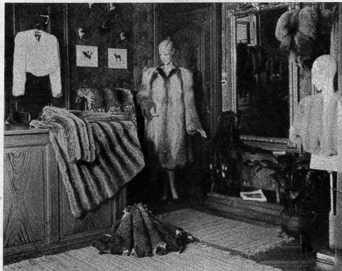
Jetzt muss es für eine Dame mit kultiviertem Geschmack ein Hochgenuss sein, sich aus dem gerade stark erweiterten Bestand edelster Felle bei Blaser-Haller am Helvetiaplatz selbst die schönsten Stücke zu einem Mantel zusammenzutragen.