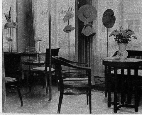
Wie zu einer Tea-Party ladet dieser Verkaufsraum bei H. Ehrensberger, Modes, im Hause Ciolina, Marktgasse 51, ein. Da und dort locken Hutständer mit fröhlichen, kecken, diskreten, klassischen, sportlichen Modellen, an denen kundige Blicke haften bleiben.