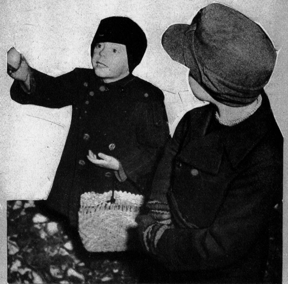
Junge Zwiebelverkäufer auf einem Bahnhof in Deutschland

Armbanduhren sind von allen Russen ganz besonders begehrt, sie tragen am liebsten gleich mehrere am gleichen Arm. Die Tochter meines Uhrmachers, noch ganz zittrig und bleich vom kaum überstandenen Schreck, erzählte: im Geschäft ihres Vaters erschien ein russischer Oberleutnant und übergab ihrem Vater einen mittelgrossen Regulator mit dem drohenden Befehl, ihm daraus mindestens fünf Armbanduhren sofort zu machen. Dass dergleichen völlig unmöglich, habe er einfach nicht glauben wollen und ihrem alten Vater mit der Pistole geschlagen und in der Raserei fast erschossen.