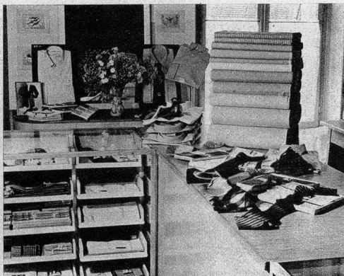
Etagengeschäfte sind vielfach zugleich Fabrikationsgeschäfte. Auch Herr Willy Müller, Waisenhausplatz 21, kauft selbst ein, leitet das Atelier, steht in persönlicher Verbindung mit der Kundschaft. Unschätzbare Vorteile des guten Etagengeschäfts.