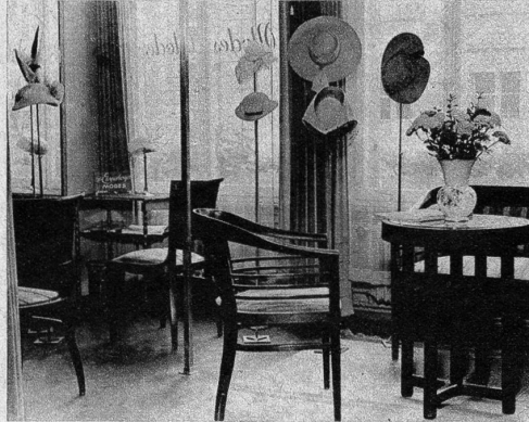
Wie zu einer Tea-Party ladet dieser Verkaufsraum bei H. Ehrensberger, Modes, im Hause Ciolina, Marktgasse 51, ein. Da und dort locken Hutständer mit fröhlichen, kecken, diskreten, klassischen, sportlichen Modellen, an denen kundige Blicke haften bleiben.