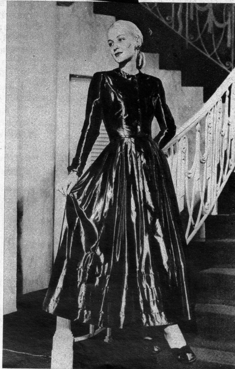
Tanzkleid aus kupferfarbenem Taffetas. Das Jupe ist sehr weit und unten mit Querfalten.