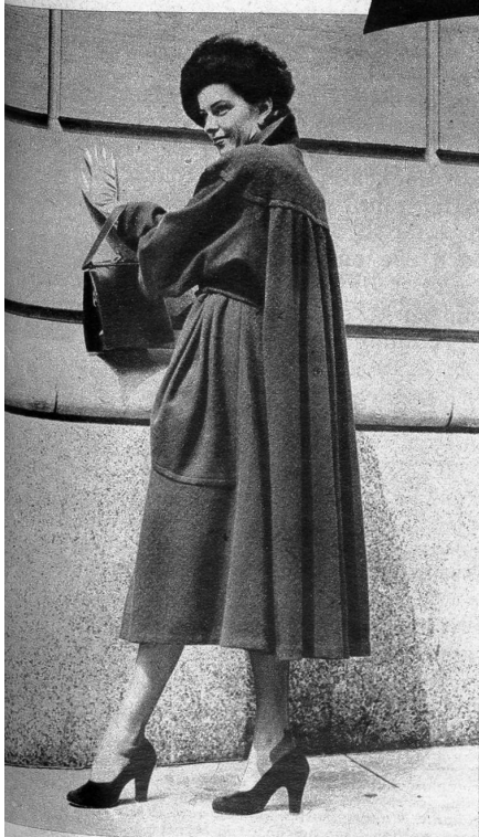
Weiter Mantel, der vorne mit einem Gürtel gehalten ist. Grosse Taschen bilden die Verzierung.