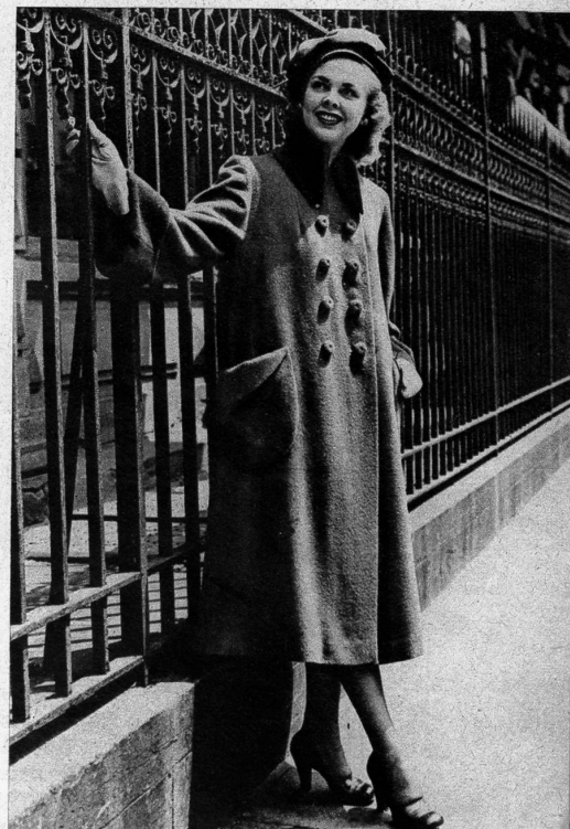
Weiter rötlicher Mantel aus Schafwolle.