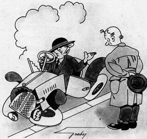
«Donnerwetter! Ich habe dir doch ausdrücklich gesagt, Gustav, du sollst die Türe nicht zu hart zuschlagen»

1 Ausdruck für Roheisenbarren, Mehrzahl. 2 Männername. 3 Poetische Bezeichnung eines unserer Schweizerseen. 4 Gebetsschluss. 5 Englische Insel, auch Fürwort. 6 Chemische Zeichen für Natrium. 7 Vokal 8 Spielkarte 9 Baumteil 10 Reiseunterbrechung zum Ruhen. 11 Altassyrische Göttin. 12 Variétékünstler. 13 Titelheld einer Wagneroper.