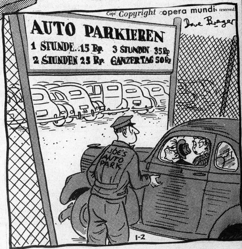
«Ich habe mich heute Morgen verschlafen, ich bin noch immer im Pyjama» «Wir parkieren besser gleich für 50 Rappen — meine Frau will nämlich einen neuen Hut einkaufen»