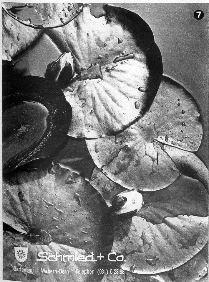
FOTO-KUNST IM DIENST DER WERBUN