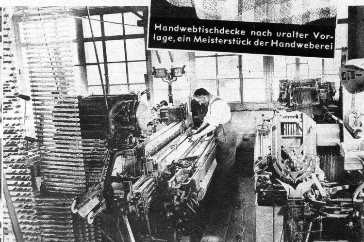
Moderne Bobinen- und Kreuzspulmaschinen präparieren das Garn für Zettelmachine und Webstuhl. Auf mehrschiffligen Stühlen entstehen die Leinengewebe