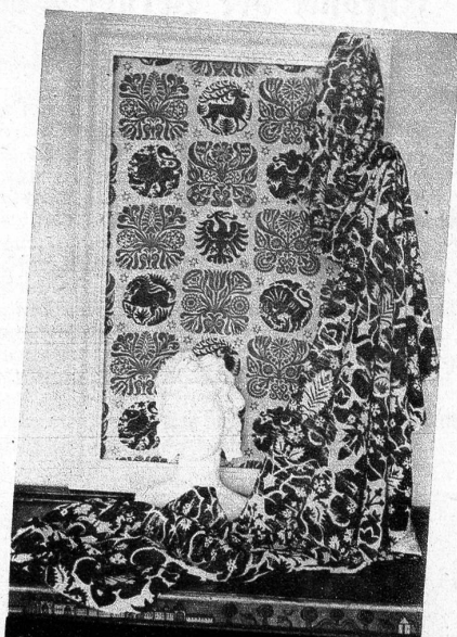
Handdrucke auf unsern hochwertigen Leinen, in heimeligen Farbtönen

dung mit andern leistungsfähigen Fabrikanten, gelang es den Inhabern, die Tuchhandlung zu einem der führenden Häuser unserer Gegend auszubauen. In eigenen gesellschaftlichen Ateliers werden Herren- und Damenkonfektion, Wäsche und Aussteuern verarbeitet. Vor Jahren wurde dem Detailgeschäft eine Engros- und Webereiabteilung angegliedert, um den Wünschen der Kundschaft noch besser entsprechen zu können. Die Spezialitäten der Weberei im Wydenhof sind: Bettücher in Leinen und Baumwolle, gestreift und karierte Kösche, die beliebten Bildstrich und Querstreifen. Die Burren-Leinen werden gebleicht und ausgerüstet in Lützelflüh und tragen den Stempel emmentaler Tradition und Solidität.