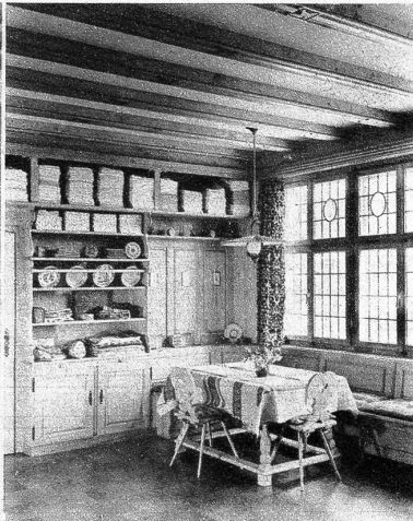
In der traditionellen Leinenstube ist der Einkauf von Burren-Leinen eine Freude