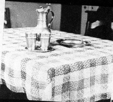
Handwebtischdecke nach uralter Vorlage, ein Meisterstück der Handweberei