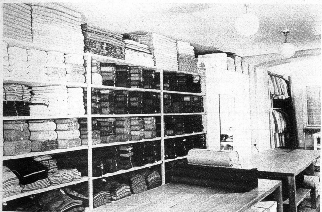
Die Verkaufsräume sind hell und geräumig und weisen eine Fülle guter Produkte für die Bekleidung auf