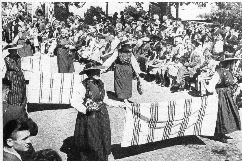
Am Nachmittag bewegte sich ein farbenfroher Festzug durch die fahnen geschmückten Strassen Langenthals. Das Bild zeigt eine Gruppe Weberinnen aus Oberhasli