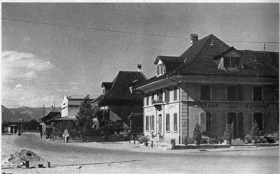
Eine schöne breite Strasse führt am Bahnhof vorbei