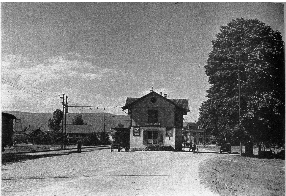
Der Bahnhof von Utzenstorf