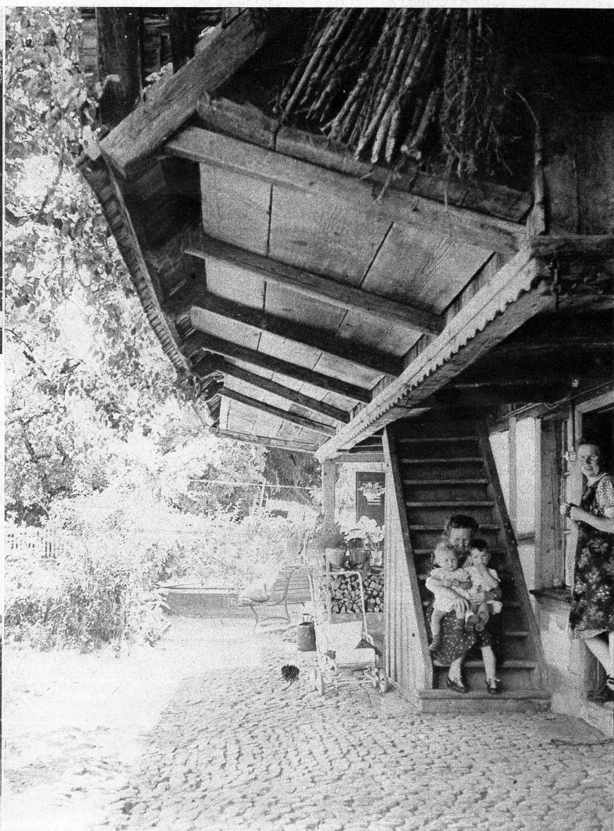
Ein heimeliger Ort