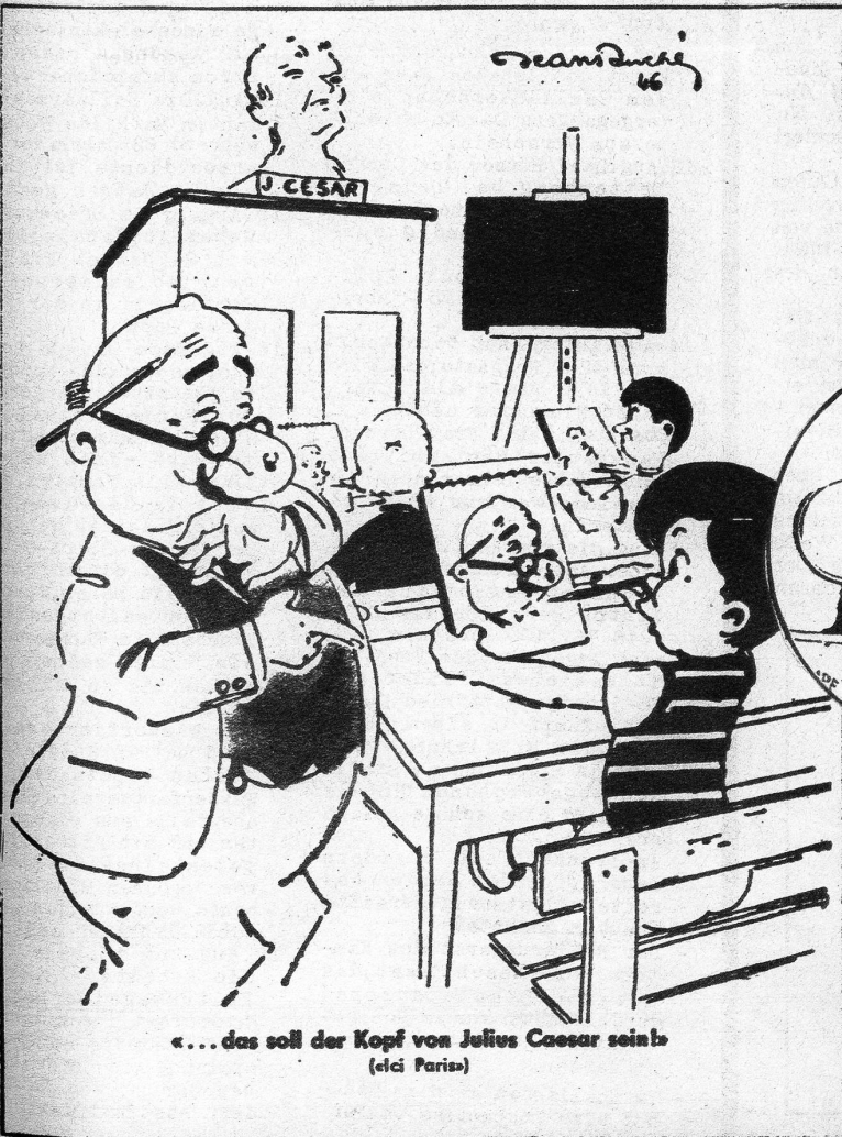
«... das soll der Kopf von Julius Caesar sein» (ici Paris)