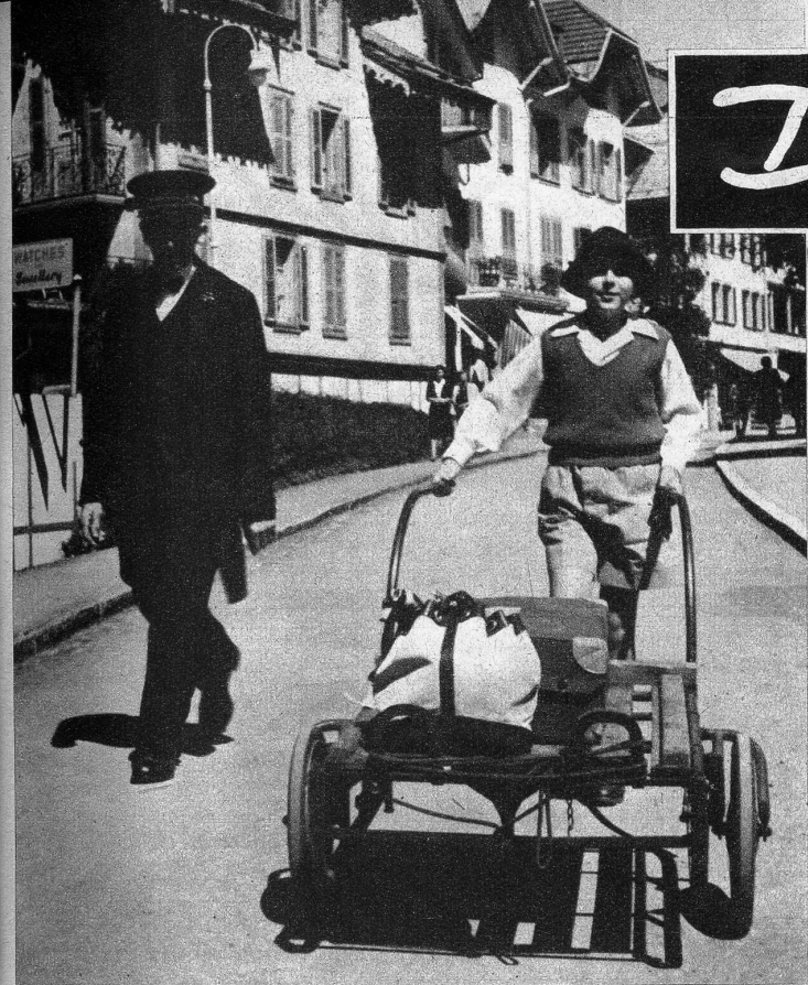
Der prinzliche Piccolo

Bekanntlich haben auch gekrönte Häupter meistens sehr ungewöhnliche Steckenpferde. Nun, der junge ägyptische Prinz Seni Toussoun, der zurzeit in Wengen in den Ferien weilt, hat sich für ein sehr demokratisches Steckenpferd entschieden: es ist vorderhand sein grösstes Vergnügen, dem Hotelportier das Gepäckzweirad an die Bahn schieben zu dürfen. Mit zunehmendem Alter wird er sich wohl ein standesgemässeres «hobby» suchen müssen (ATP)