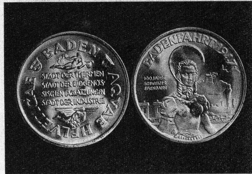
Gedenktaler zur Badenfahrt 1947