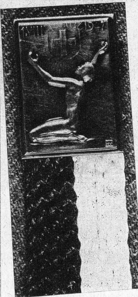
Die 1. August-Plakette 1947