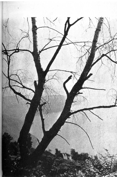
Frei wie der Wind und Vögel lebt es sich dort oben, denn die Steuereinzüger von Brissago verirren sich wohl kaum je in diese Wildnis am Berge. In der Tiefe das Maggia Delta mit Ascona

In Ronco sopra Ascona selber hat es einige gute Pinten. Darin verweilen die meisten Hoehntonisten, bis der letzte Bus sie mühelos wieder nach Ascona zurückbringen kann. Nur ganz Waghalsige und solche, die auf Abenteuer aus sind, finden